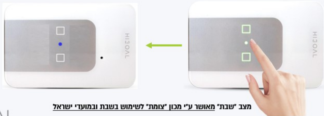
מצב "שבת" מאושר ע"י מכון "צומת" לשימוש בשבת ובמועדי ישראל