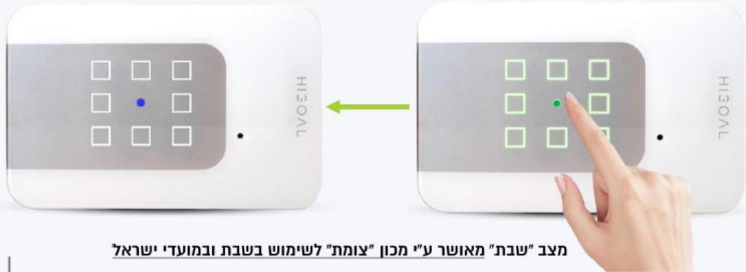
מצב "שבת" מאושר ע"י מכון "צומת" לשימוש בשבת ובמועדי ישראל